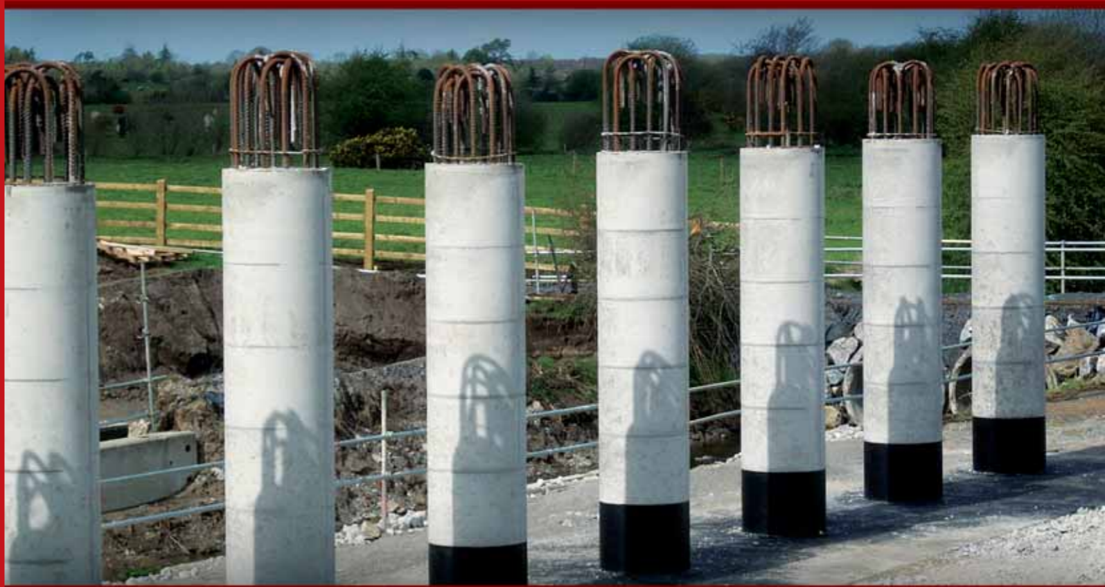
La 1ª cassaforma in plastica per colonne tonde